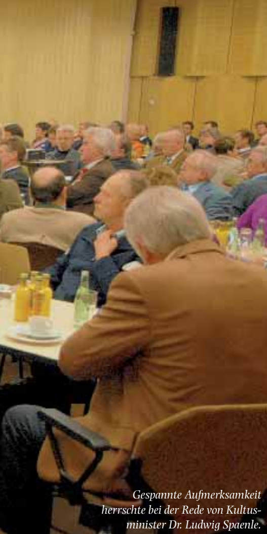
Gespannte Aufmerksamkeit herrschte bei der Rede von Kultusminister Dr. Ludwig Spaenle.