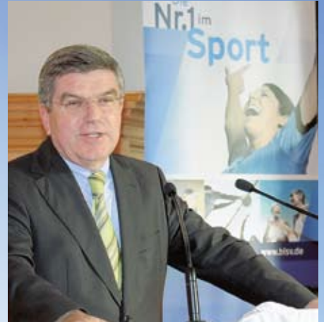
DOSB-Präsident Dr. Thomas Bach sichert volle Unterstützung zu.